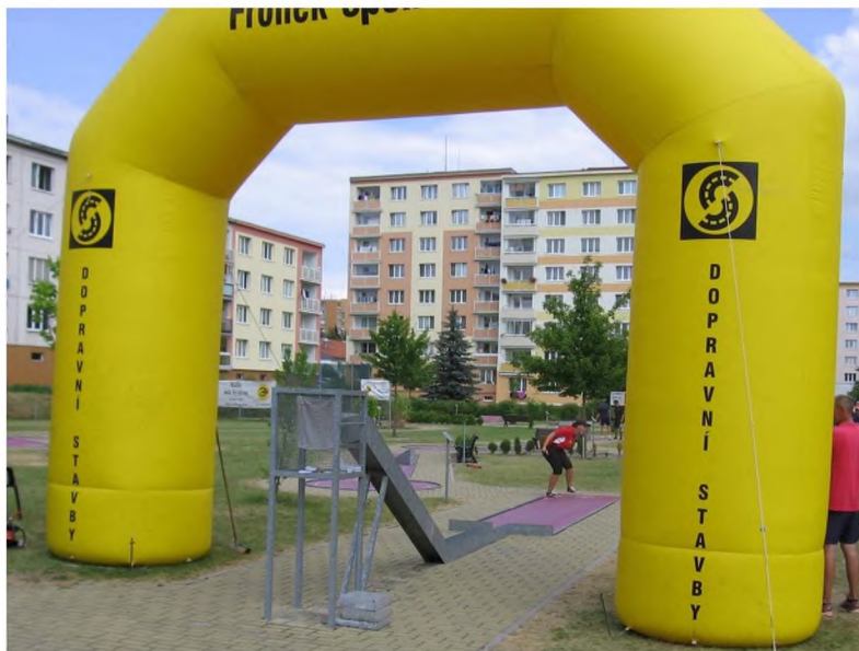
Na účastníky Mistrovství ČR 2017 v Rakovníku čeká proslulá slavobrána sponzora firmy Froněk s. r. o.