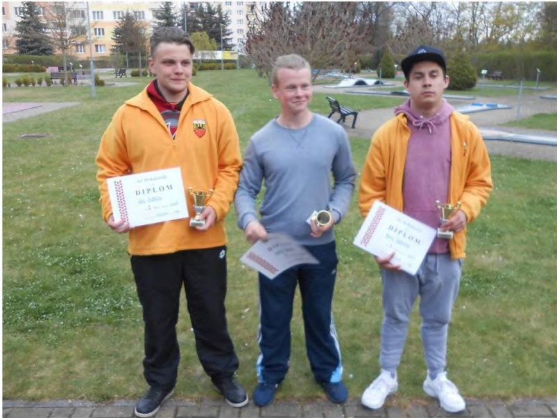
O 4 roky později stejná trojice na stupních vítězů v Rakovníku už v kategorii juniorů. Všichni ověnceni tituly Mistrů Evropy z roku 2015.